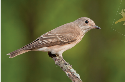
Lejsek šedý Muscicapa striata